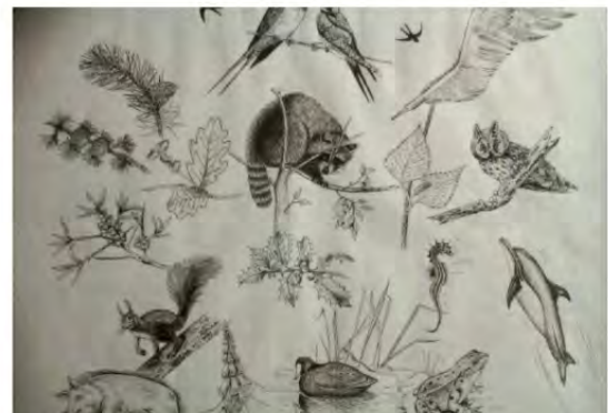
F. de Beer